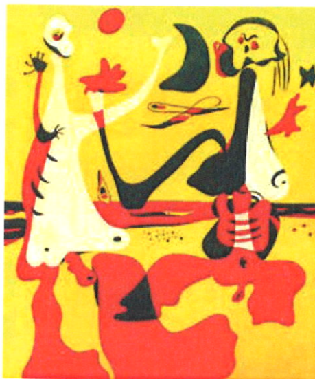
Joan Miró, Figures a la sorra . Publicat a la revista D'Ací, d'Allà , pochoir (1932)