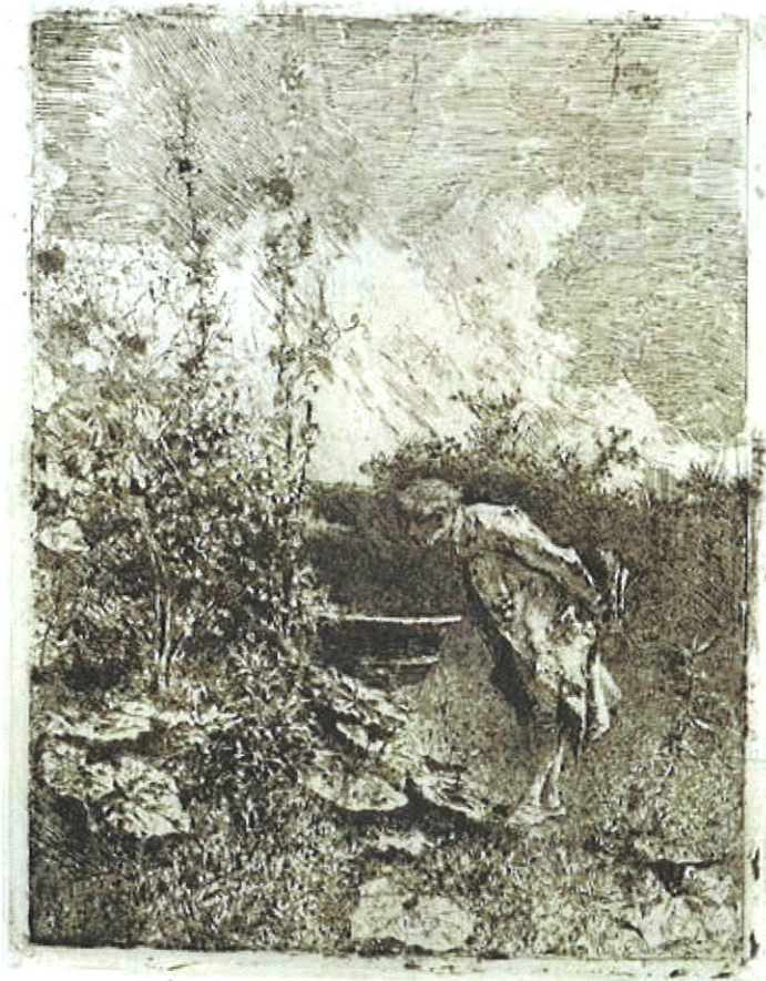
Marià Fortuny, El botànic . Aiguafort (1869)