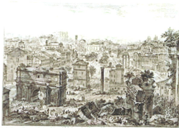
Giovanni Battista Piranesi, Veduta di Campo Vaccino . Aiguafort (1772)