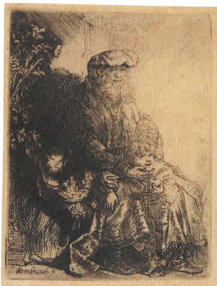
Rembrandt, Abraham acarasant Isaac . Aiguafort (1645)