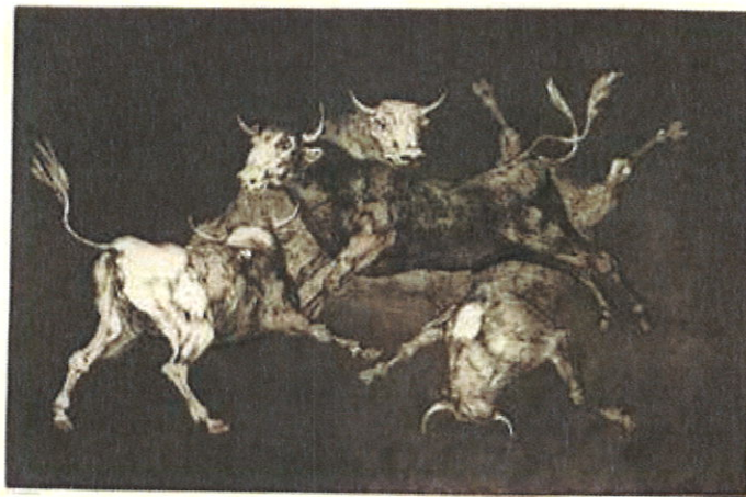
Francisco de Goya, Pluja de toros . Aiguafort, aiguatinta i punta seca (1816)