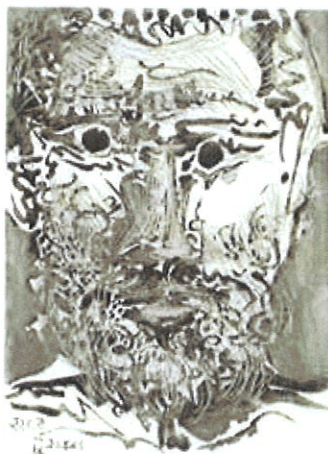
Pablo Picasso, Tête d'homme barbu II . Aiguafort i aiguatinta (1965)