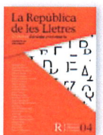
04. La República de les Lletres. 25 plomes d'avui per proclamar-la (2018) Coordinadora: Xènia Bussé

Preu per volum: 16 euros / Subscriptors: 12 euros