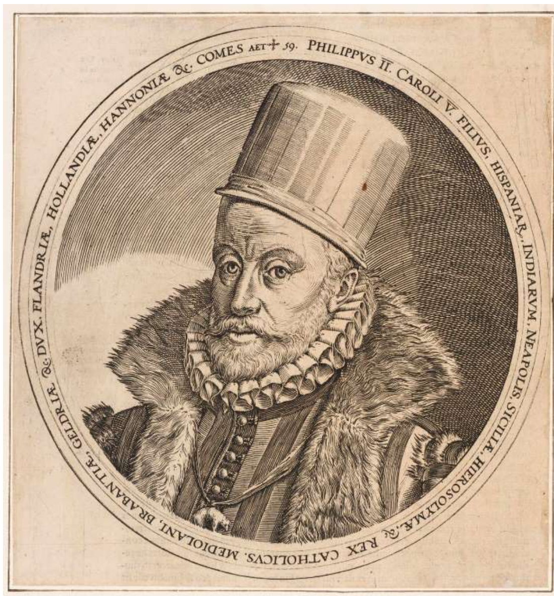
Felip II. Anònim, aiguafort, c. 1590, Col·lecció Gelonch Viladegut

Comptat i debatut tot el que hem analitzat (manca d'oferta per tal d'evitar el contagi, Inquisició, pedagogia de la por i barreja entre catolicitat i hispanitat) ens pot ajudar a entendre perquè fou tant difícil que el luteranisme pogués arrelar a Catalunya...De fet, no hi va arrelar. L'objectiu primigeni i conjunt de l'Església catòlica i de la Monarquia hispànica es va complir.